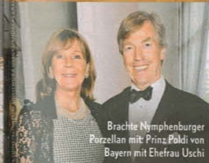
Brachte Nymphenburger Porzellan mit: Prinz Poldi von Bayern mit Ehefrau Uschi