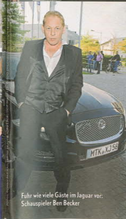
Fuhr wie viele Gäste im Jaguar vor: Schauspieler Ben Becker