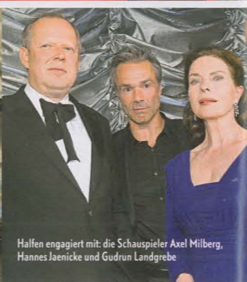
Helfen engagiert mit: die Schauspieler Axel Milberg, Hannes Jaenicke und Gudrun Landgrebe